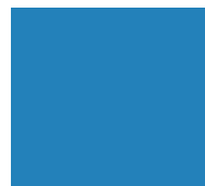
1524 AZUL PINTUCOM